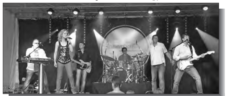
„Remember-Band“ auf ihrer „Wohnzimmer-Bühne“ vor dem Rathaus Giesenkirchen.

Gruß- und Dankesworte an den Vorstand des Heimatverein sagten